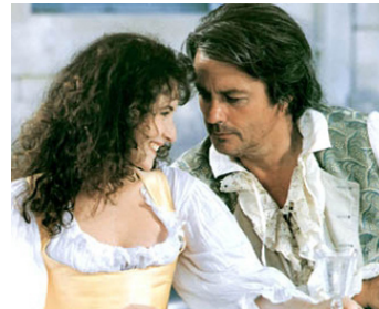
1991 LE RETOUR DE CASANOVA d'Édouard Niermans avec Elsa Lunghini