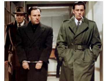
1975 FLIC STORY de Jacques Deray avec Jean-Louis Trintignant