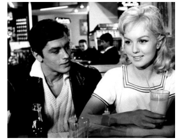
1958 FAIBLES FEMMES de Michel Boisrond avec Mylène Demongeot