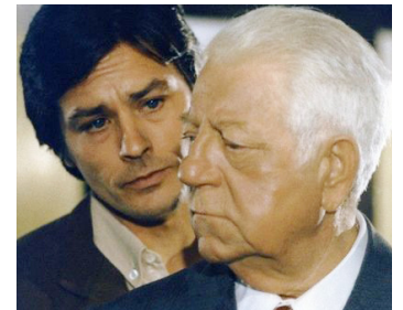
1973 DEUX HOMMES DANS LA VILLE de José Giovanni avec Jean Gabin