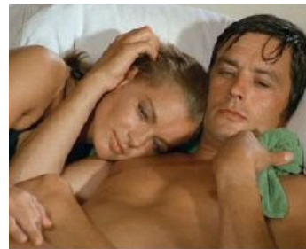
1968 LA PISCINE de Jacques Deray avec Romy Schneider