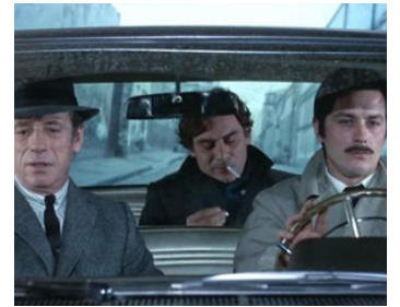
1970 LE CERCLE ROUGE de Jean-Pierre Melville avec Yves Montand, Gian-Maria Volonte