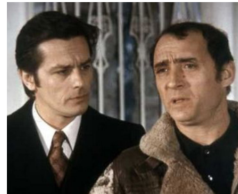
1974 LES SEINS DE GLACE de Georges Lautner avec Claude Brasseur