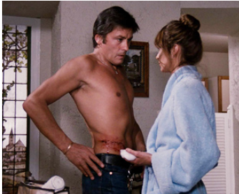
1981 POUR LA PEAU D'UN FLIC d'Alain Delon avec Anne Parillaud