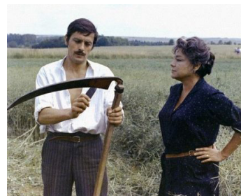
1971 LA VEUVE COUDERC de Pierre Granier-Deferre avec Simone Signoret