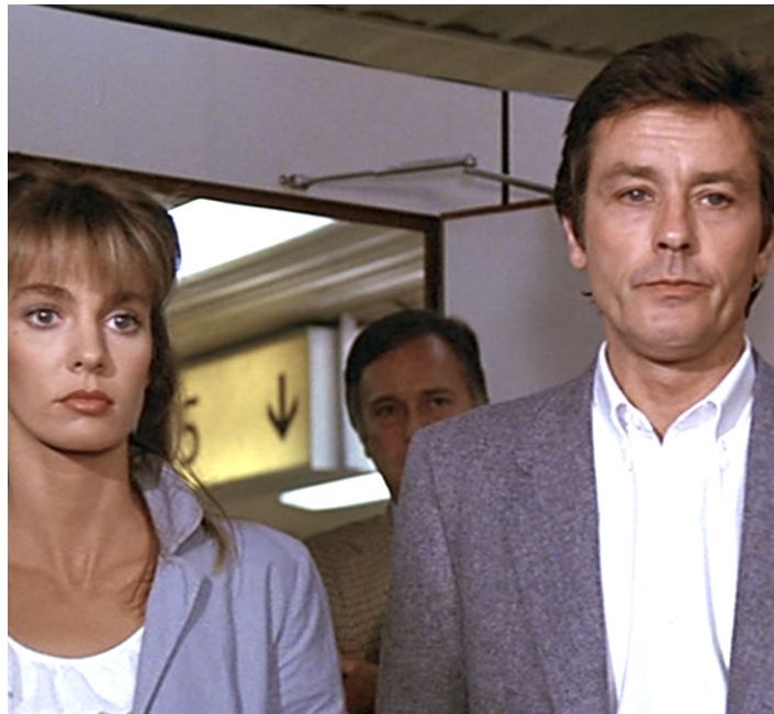
1982 LE BATTANT d'Alain Delon avec Anne Parillaud