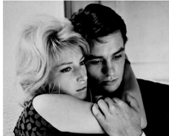
1961 L'ÉCLIPSE (L'Elisse) de Michelangelo Antonioni avec Monica Vitti