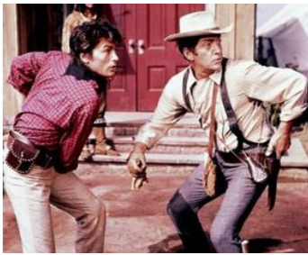
1966 TEXAS NOUS VOILÀ (Texas across the River) de Michael Gordon avec Dean Martin