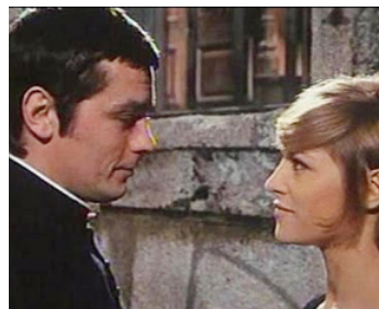
1970 DOUCEMENT LES BASSES ! de Jacques Deray avec Nathalie Delon