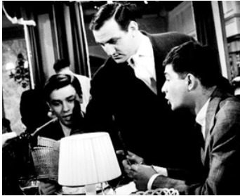
1959 LE CHEMIN DES ÉCOLIERS de Michel Boisrond avec Lino Ventura, Jean-Claude Brialy