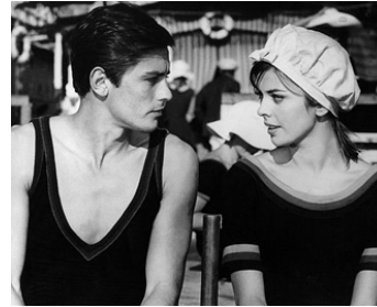
1960 QUELLE JOIE DE VIVRE ! (Che gioia vivere) de René Clément avec Barbara Lass