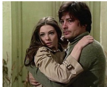
1972 LE PROFESSEUR (La prima notte di quiete) de Valerio Zurlini avec Sonia Petrovna