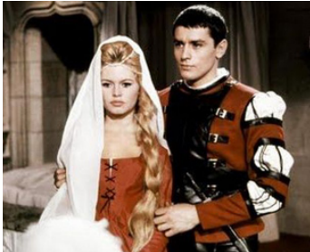
1961 LES AMOURS CÉLÈBRES (Agnès Bernauer) de Michel Boisrond avec Brigitte Bardot