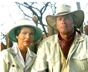
2003 LE LION de José Pinheiro avec Omella Muti