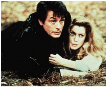
1980 LE CHOC de Robin Davis avec Catherine Deneuve