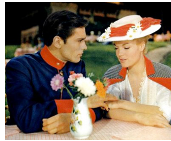
1958 CHRISTINE de Pierre Gaspard-Huit avec Romy Schneider