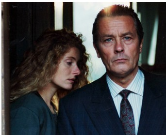
1989 NOUVELLE VAGUE de Jean-Luc Godard avec Domiziana Giordano