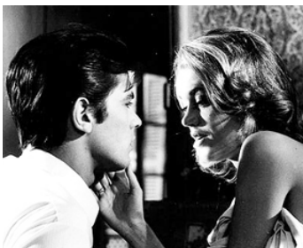
1963 LES FÉLINS (Joyhouse) de René Clément avec Jane Fonda