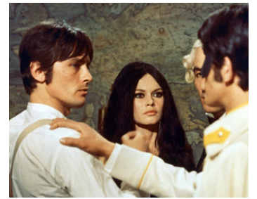
1967 HISTOIRES EXTRAORDINAIRES de Louis Malle avec Brigitte Bardot