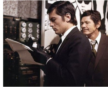
1968 ADIEU L'AMI de Jean Herman avec Charles Bronson