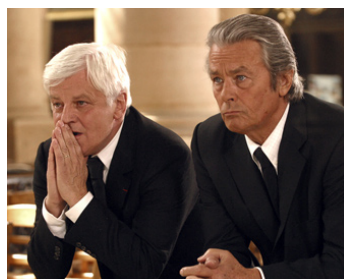
2004 FRANK RIVA de Patrick Jamain avec Jacques Perrin