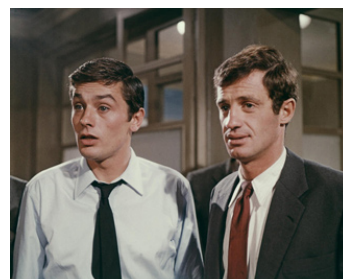
1965 PARIS BRÛLE-T-IL de René Clément avec Jean-Paul Belmondo