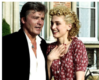
1995 LES CENT ET UNE NUITS d'Agnès Varda avec Julie Gayet