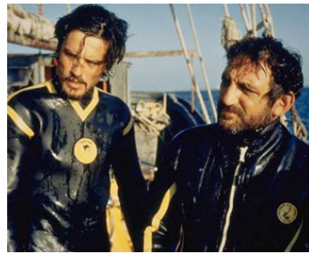
1966 LES AVENTURIERS de Robert Enrico avec Lino Ventura