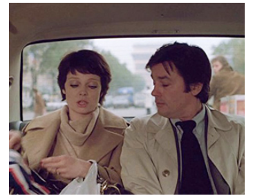
1981 TÉHÉRAN 43, NID D'ESPIONS (Teheran 43) d'A. Alov & V. Naoumov avec N. Belokhovostikova