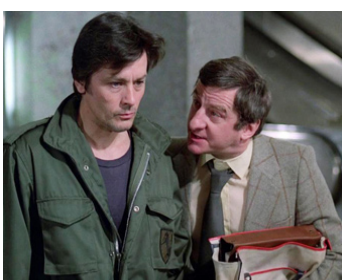
1977 MORT D'UN POURRI de Georges Lautner avec Michel Aumont