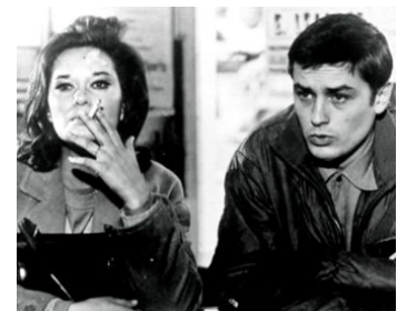
1964 L'INSOUMIS d'Alain Cavalier avec Léa Massari