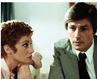
1976 COMME UN BOOMERANG de José Giovanni avec Carla Gravina