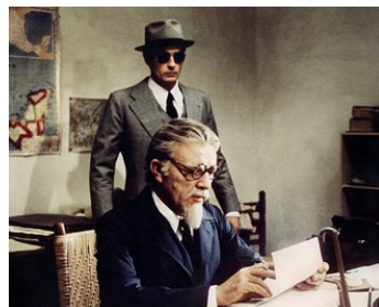
1971 L'ASSASSINAT DE TROTSKY (The Assassination of Trotsky) de Joseph Losey avec Richard Burton