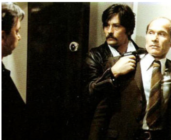
1975 LE GITAN de José Giovanni avec Paul Meurisse, Marcel Bozzuffi