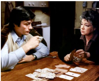
1972 LES GRANGES BRÛLÉES de Jean Chapot avec Simone Signoret