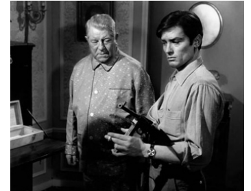
1962 MÉLODIE EN SOUS-SOL de Henri Verneuil avec Jean Gabin