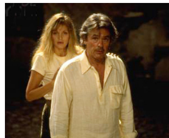
1996 LE JOUR ET LA NUIT de Bernard-Henri Lévy avec Arielle Dombasle