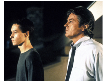
1992 UN CRIME de Jacques Deray avec Manuel Blanc