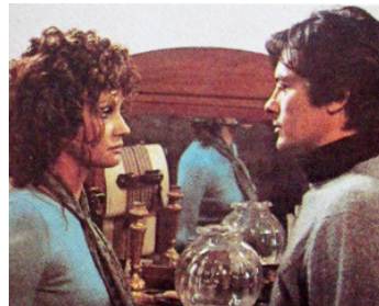
1973 BIG GUNS (Tony Arzenta) de Duccio Tessari avec Carla Gravina