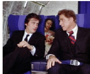
1972 SCORPIO (Scorpio) de Michael Winner avec Burt Lancaster