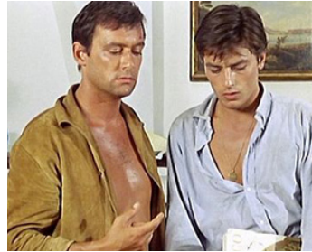
1959 PLEIN SOLEIL de René Clément avec Maurice Ronet