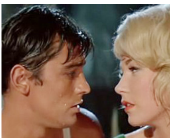
1964 LA ROLL-ROYCE JAUNE (The yellow Roll-Royce) d'A. Asquith avec Shirley MacLaine