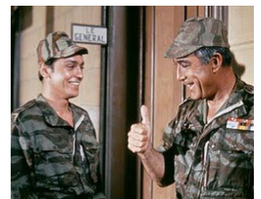
1965 LES CENTURIONS (Lost Command) de Mark Robson avec Anthony Quinn