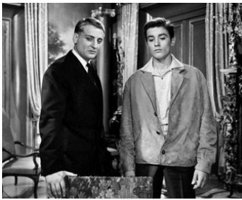
1956 QUAND LA FEMME S'EN MÊLE d'Yves Allégret avec Bruno Crémier