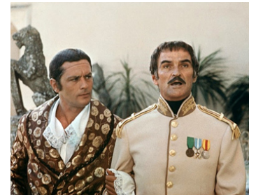
1974 ZORRO (El Zorro, la belva del Colorado) de Duccio Tessari avec Stanley Baker