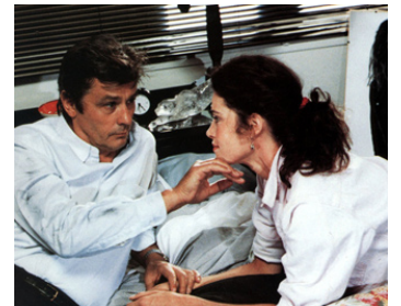
1988 NE RÉVEILLEZ PAS UN FLIC QUI DORT de José Pinheiro avec Consuelo de Haviland