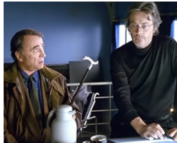
1990 DANCING MACHINE de Gilles Béhat avec Claude Brasseur