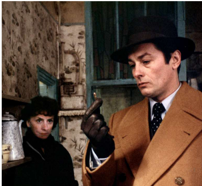
1975 MONSIEUR KLEIN de Joseph Losey avec Suzanne Flon