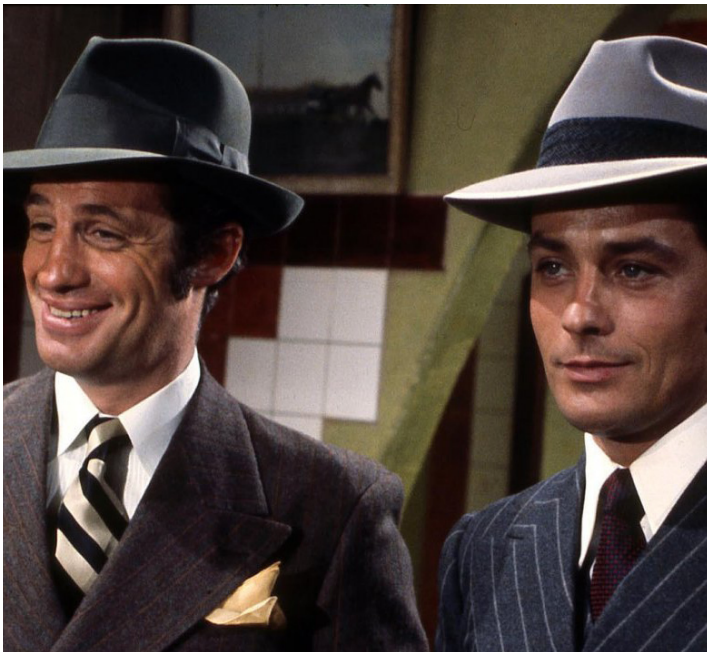
1969 BORSALINO de Jacques Deray avec Jean-Paul Belmondo