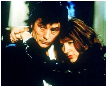
1984 NOTRE HISTOIRE de Bertrand Blier avec Nathalie Baye