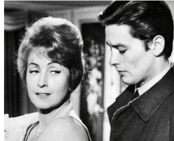
1962 LE DIABLE ET LES DIX COMMANDEMENTS de Julien Duvivier avec Danielle Darrieux