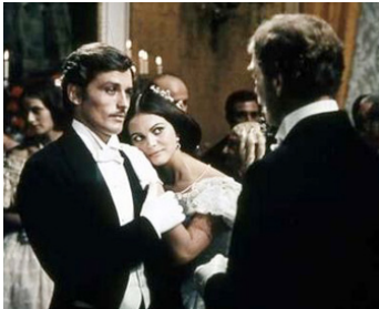
1962 LE GUÉPARD (Il Gattopardo) de Luchino Visconti avec Claudia Cardinale, Burt Lancaster