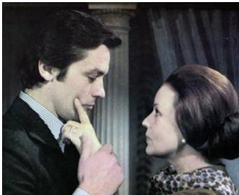
1973 LA RACE DES SEIGNEURS de Pierre Granier-Deferre avec Jeanne Moreau