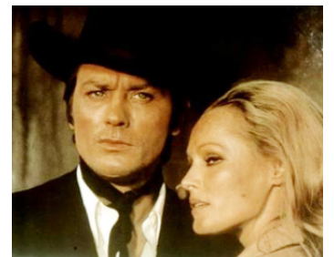
1971 SOLEIL ROUGE (Red Sun) de Terence Young avec Ursula Andress