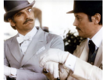
1983 UN AMOUR DE SWANN de Volker Schlöndorff avec Jeremy Irons