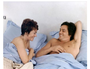
1972 TRAITEMENT DE CHOC d'Alain Jessua avec Annie Girardot