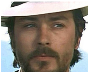
1970 FANTASIA CHEZ LES PLOUCS de Gérard Pirès (apparition)