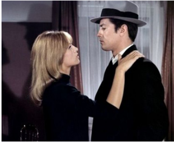
1967 LE SAMOURAÏ de Jean-Pierre Melville avec Nathalie Delon