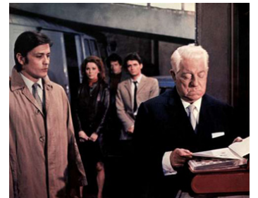
1969 LE CLAN DES SICILIENS de Henri Verneuil avec Irina Demick, Marc Porel, Jean Gabin