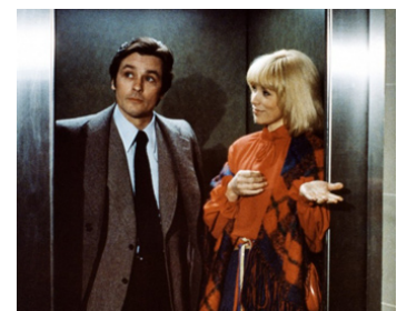
1977 L'HOMME PRESSÉ d'Édouard Molinaro avec Mireille Darc