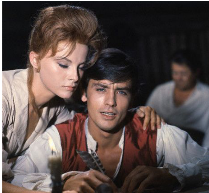
1963 LA TULIPE NOIRE de Christian-Jaque avec Véra Lisi