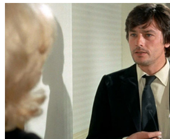
1971 IL ÉTAIT UNE FOIS UN FLIC de Georges Lautner avec Mireille Darc (apparition)