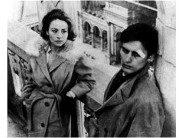
1960 ROCCO ET SES FRÈRES (Rocco e i suoi fratelli) de Luchino Visconti avec Annie Girardot