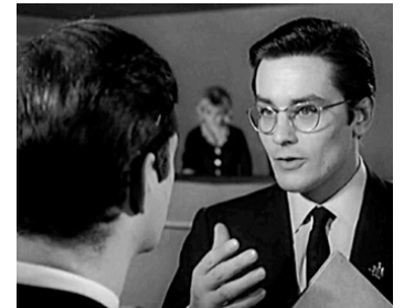
1963 CARAMBOLAGES de Marcel Bluwal avec Jean-Claude Brialy (apparition)