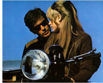
1967 LA MOTOCYCLETTE (Girl on a Motorcycle) de Jack Cardiff avec Joanna Shimkus