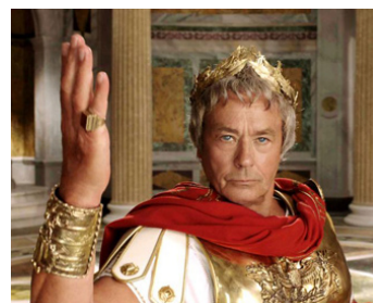
2007 ASTÉRIX AUX JEUX OLYMPIQUES de Thomas Langmann & Frédéric Forestier