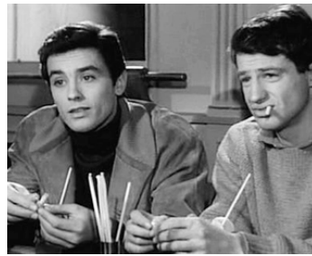
1957 SOIS BELLE ET TAIS-TOI de Marc Allégret avec Jean-Paul Belmondo