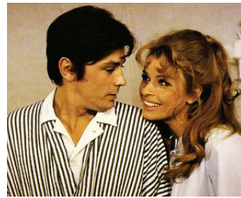
1966 DIABOLIQUEMENT VÔTRE de Julien Duvivier avec Senta Berger